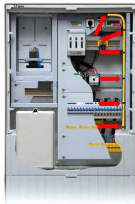
Ukázka uchytení ASES-TS ve el. skříni

Technická data: Obsah chráněného prostoru: 20-2000 litrů (dle projektu)