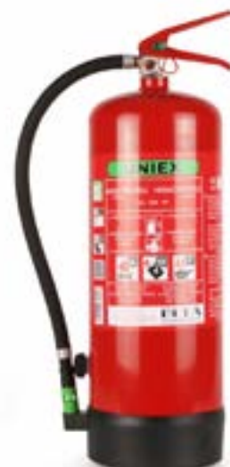
UNIEX Pěnový hasicí přístroj F9 BETA WLi - 9L