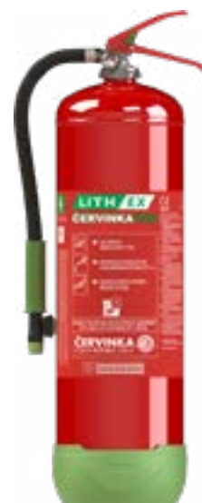
Hasicí přístroj AVD LITH EX9 – 9 l