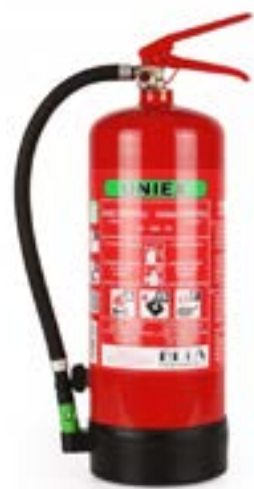
UNIEX Pěnový hasicí přístroj F6 BETA WLi - 6L