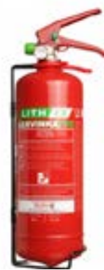
Hasicí přístroj AVD LITH EX2 – 2 l