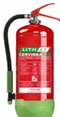
Hasicí přístroj AVD LITH EX6 – 6 l